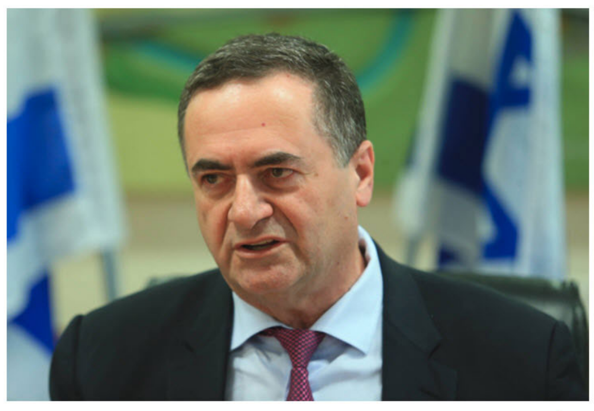
ישראל כן, שר התחבורה

ההוראה הגורפת מיטיבה בעיקר עם החברות איסתא ופמי פרימיים שמחזיקות בזיכיון ממשרד התחבורה להנפקת רישיונות נהיגה בינלאומיים. לשתי החברות יש 36 תחנות שבהן ניתן להנפיק רישיון נהיגה בינלאומי תמורת 20 שקל. ב-2017 כולה הונפקו 300 אלף רישיונות נהיגה בינלאומיים, ולטענת גורמים העוסקים בתחום, מספר ההנפקות זינק ב-400% בשבוע האחרון בעקבות הודעת משרד התחבורה.